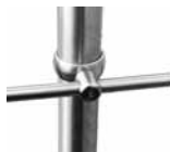
Kniestab und Kniestabhalter

Das individuell an die Objektgegebenheiten anpassbare Systemgeländer wird durch unsere Anwendungstechnik objektbezogen geplant. Sie erhalten hierzu auf Anfrage gerne eine Offerte inkl. kompletter Stückliste. Nachfolgend einige Einzelteile: