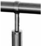
Handlauf und Handlaufhalter